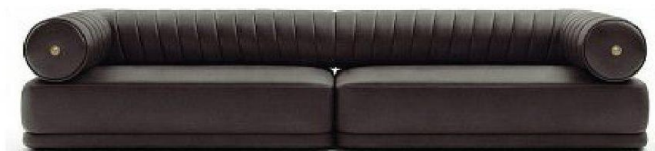
Divano Meteora di Versace Home

La proprietà intellettuale è riconducibile alla fonte specificata in testa alla pagina. Il ritaglio stampa è da intendersi per uso privato