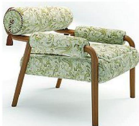
Poltrona Opus di Etro