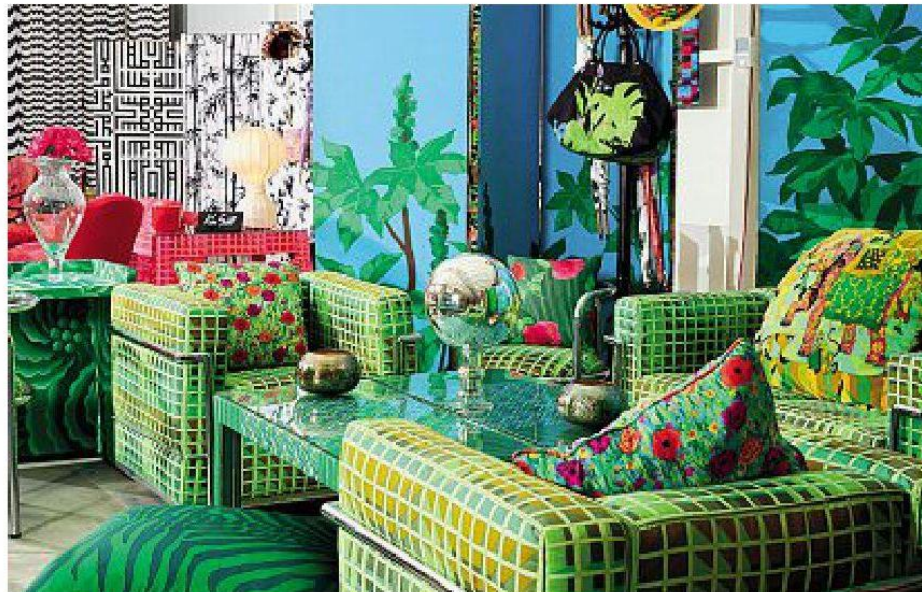
Ken Scott Suite, in collaborazione con Mantero e Speronari Suites