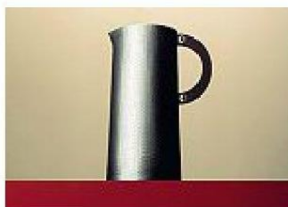
Brocca Palladion di Hermès

bottiglie pregiate e bicchieri in cristallo molato a mano.