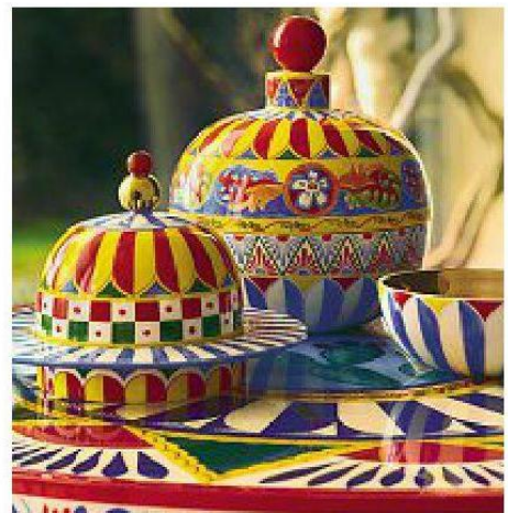
Dolce&Gabbana, porta oggetti collezione Carretto Siciliano