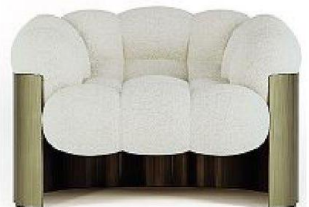
Poltrona Onda di Elie Saab Maison