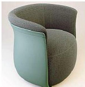
Poltroncina Peekachill di Fendi Casa

È un omaggio allo stile degli interni eleganti degli appartamenti milanesi la poltrona Onda di Elie Saab Maison, che rientra nella collezione La Milanese House. Un richiamo alla creatività della città (e al design) arriva anche da Speronari Suites che inaugura l'esclusiva Ken Scott Suite , in collaborazione con Mantero . Carta da parati con disegni e stampe — da una ricerca nell'archivio — colorano le stanze con un intenso uso del tessile. Nella Presidential Office di Stefano Ricci , il Cigar & Bar Vault si sviluppa in orizzontale ma con un meccanismo di apertura verticale e due elementi laterali per