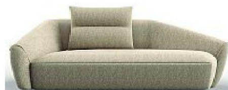
Talism, divano di Carlo Colombo per Trussardi Casa